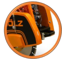
Poignée avant pour l'aide au chargement

Scie à sol robuste avec poignées anti-vibrations et plongée par volant. Compacte, maniable, puissante et stable : la référence sur les chantiers du BTP