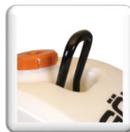
Anneau de levage