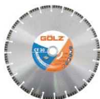
CT30 Béton Standard CT40 Béton Prémium LB55 Béton Prémium

Nous recommandons l'utilisation de nos disques diamantés pour votre FS175 :