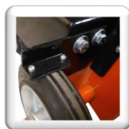
Frein de parc