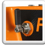
Loquet de blocage plongée