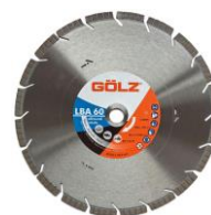
LBA 60 Mixte Standard LBA66 Mixte Technique LCA65 Mixte Prémium