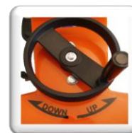
Plongée par volant