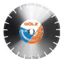
FB10 Béton Frais Technique