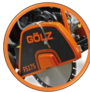
Capot protecteur du disque de coupe monté sur un axe facilite le changement du disque