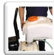
Bac à eau amovible, facile à remplir