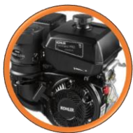
Moteur KOHLER CH440 Filtre Cyclonique