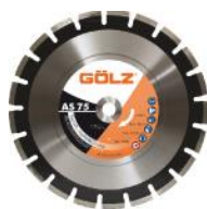
AS60 Asphalte Standard AS75 Asphalte Prémium AS85 Asphalte Prémium