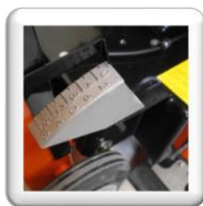
Indicateur de profondeur de coupe